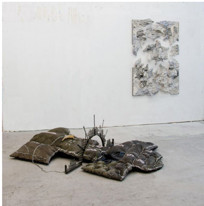
Vue de l'exposition «La couleur des ténèbres» Commissariat Paulo Iverno, 3537, 2023

Pendant la résidence, il mène un projet d'installation et vidéo explorant les thèmes de l'appropriation et de la gentrification. Il remet en question la place de l'artiste dans ce contexte complexe et ambiguë sous l'influence de l'air du temps et de la consommation. Ce projet constitue également le troisième volet d'une série de films qui explore différents territoires en région parisienne.