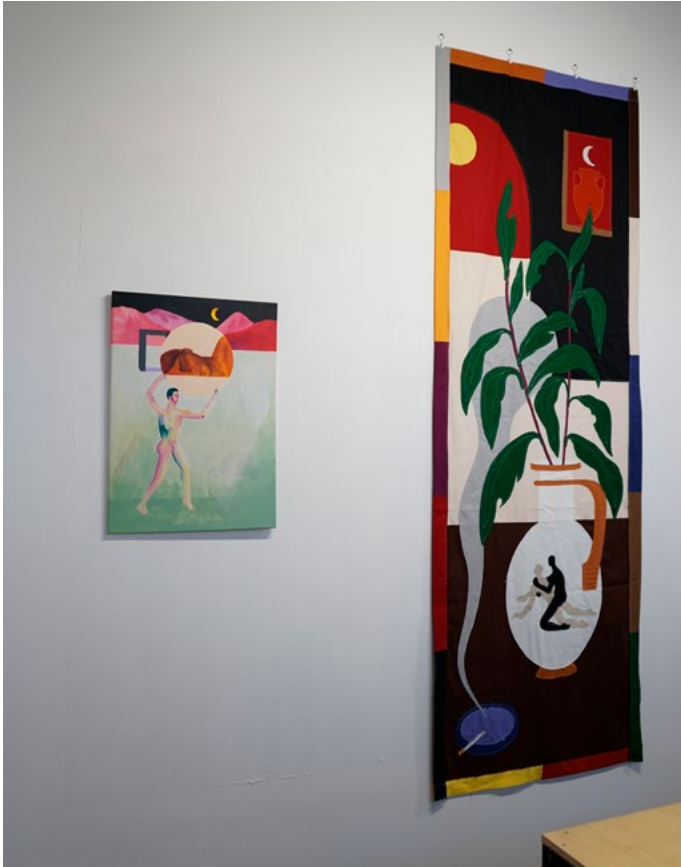
The dreamer and Cold cigaret (vue d'atelier)