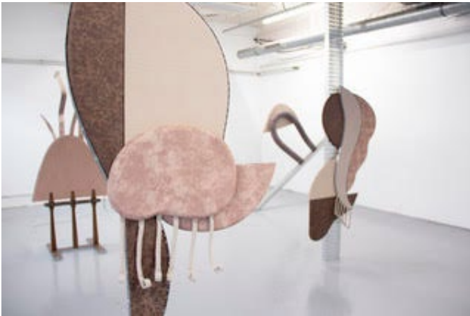
Vue d'exposition, 2024

L'année dernière, elle a été résidente à la Cité Internationale des Arts à Paris.