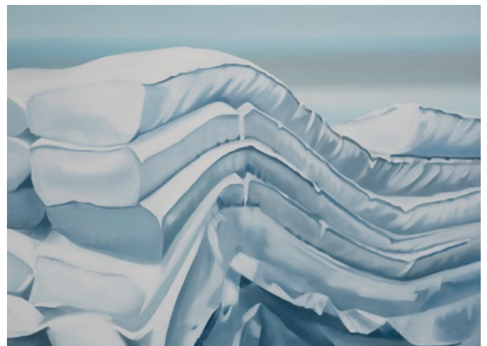
Pascale Rémita, Sans titre , 2019, Huile sur toile 120 x 160 cm

Pascale Rémita est une artiste peintre contemporaine. Sa pratique est le fruit d'un dialogue qui s'entretient au travers de la toile, de l'image numérique et vidéo. L'artiste travaille sur les notions de perception du réel dans une exploration sensible des phénomènes, le rapport de l'individu au paysage, au territoire. Elle reste fidèle à cette idée d'une mise à plat du monde par la peinture, en apportant un soin particulier aux traitements des images qu'elle collecte sur internet ou capte lors de ses voyages ou résidences artistiques. Sur le mode de l'atlas improvisé, elle montre leur trajectoire nomade. Parce que la peinture et la vidéo développent des stratégies de la représentation, elle en révèle des voisinages au jeu de l'un dans l'autre. Par porosité et perméabilité, une des particularités de la pratique de l'artiste réside dans la façon dont celle-ci remet en jeu nos habitudes de perception de l'image peinte ou filmée. En aménageant un jeu de correspondances sensibles à travers le storyboard imagé ou elliptique de ses pièces, elle rend compte d'une conscience éclatée et fragmentaire des phénomènes. Pascale Rémita est diplômée de l'École Supérieure des Beaux-Arts de Nantes et de l'Université de Paris I Sorbonne. Ses œuvres figurent dans de nombreuses artothèques, collections privées, et les collections publiques des Frac Poitou-Charentes et Pays de la Loire.